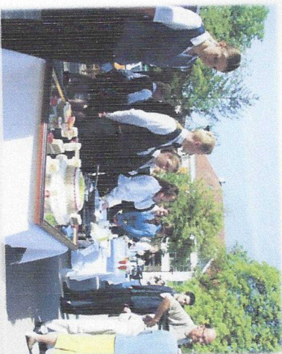
„Mali Gastro“ – humanitarna akcija

Regionalni centar kompetencija u turizmu i ugostiteljstvu